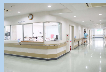
スタッフステーション